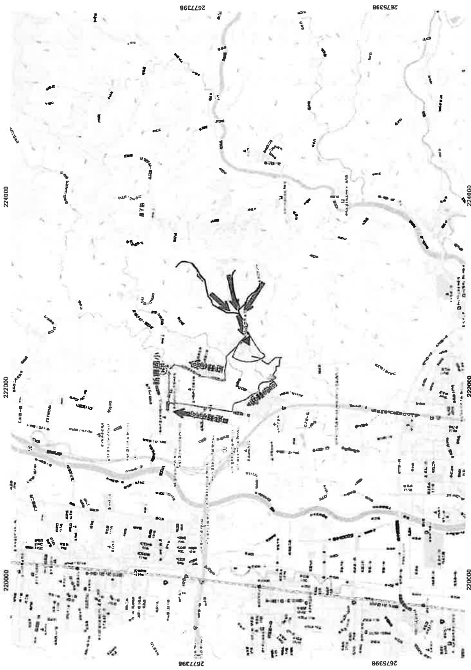
臺中市潭子區聚興里 土石流及大規模崩塌疏散避難圖1